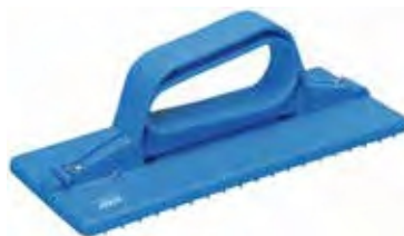
Padhalter, Handmodell, 235 mm Mit Handgriff, Fixierung der Pads durch Edelstahlhaken. Maße: 235 x 100 mm, blau, zur Reinigung von Wänden und Böden.