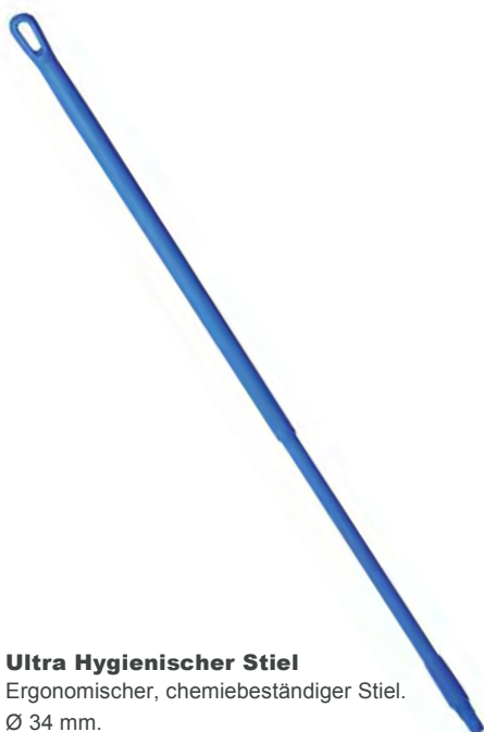
Ultra Hygienischer Stiel Ergonomischer, chemiebeständiger Stiel. Ø 34 mm.

Art.: 2500170393 (medium) Art.: 2500170373 (hart)