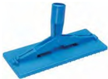
Padhalter, Bodenmodell, 235 mm Mit Stielaufnahme, Fixierung der Pads durch Edelstahlhaken. Maße: 235 x 100 mm, blau, zur Reinigung von Wänden und Böden.