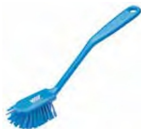
Spülbürste, 280 mm, medium, blau Mit Schaberand und ausgestellten, mittelharten Borsten.

Art.: 2500141873 (medium) Art.: 2500141893 (hart)