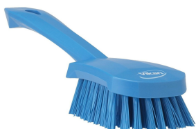
Kurzstiellige Bürste, 280 mm, blau Harte oder, mittelharte Borsten

Art.: 250150600 (Stück/ VE weich) Art.: 250015524 (Stück/ VE mittel) Art.: 250015523 (Stück/ VE hart)