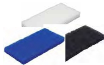
Pad 125 x 245 mm Weiß = weich, blau = mittel, braun = hart.

Art.: 250150600 (Stück/ VE weich) Art.: 250015524 (Stück/ VE mittel) Art.: 250015523 (Stück/ VE hart)