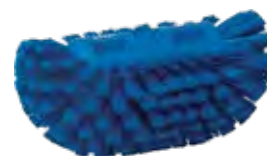
Tankbürste 205 mm Zur Reinigung von Tanks und Behältern in der Lebensmittelindustrie, Borstenlänge: 40 mm, Passt auf jeden Vikan-Stiel mit Gewinde.

Art.: 2500170393 (medium) Art.: 2500170373 (hart)