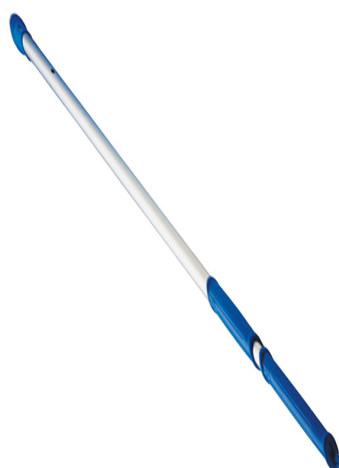
Tele - Stange 2 x 3,75 m silber (eloxiert), besonders stabil.

Art.: 2500129623 (1500 mm) Art.: 2500129643 (1700 mm)