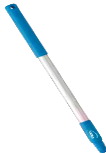
Aluminiumstiel, 650 mm Kurzer Aluminiumstiel (eloxiert), PP. Ideal für enge Räume. Ø 31 mm.